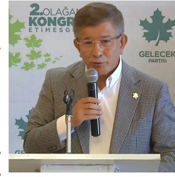
Gelecek Partisi Genel Başkanı Ahmet Davutoğlu, Ankara'da Etimesgut 2'nci

Gelecek Partisi lideri Ahmet Davutoğlu, AKP ile olası bir ittifaka kapıları kapatmayarak, yerel seçimler için "Hiç kimseyi dışlamıyoruz, hiç kimseyi kenarda tutmuyoruz" dedi. Davutoğlu'nun bu tutum ve sözleri Konya'da partililer tarafından şaşkınlıkla karşılandı