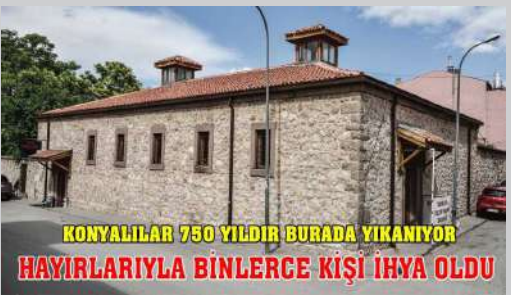
KONYALILAR 750 YILDIR BURADA YIKANİYOR HAYIRLARIYLA BINLERCE KİŞİ İHYA OLDU