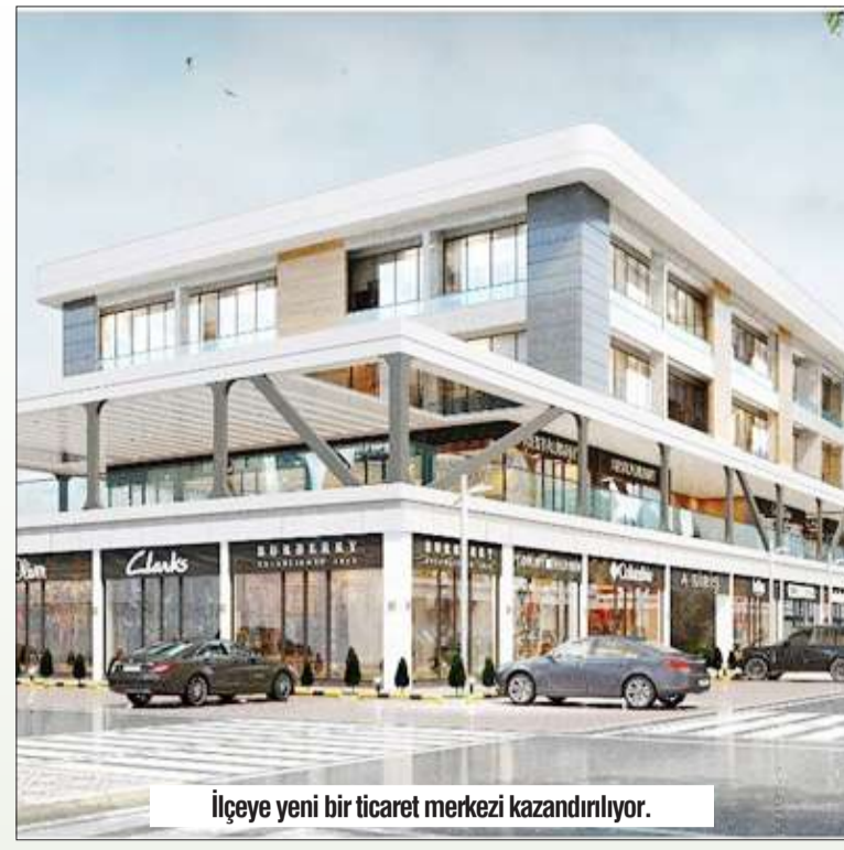
İlçeye yeni bir ticaret merkezi kazandırılıyor.