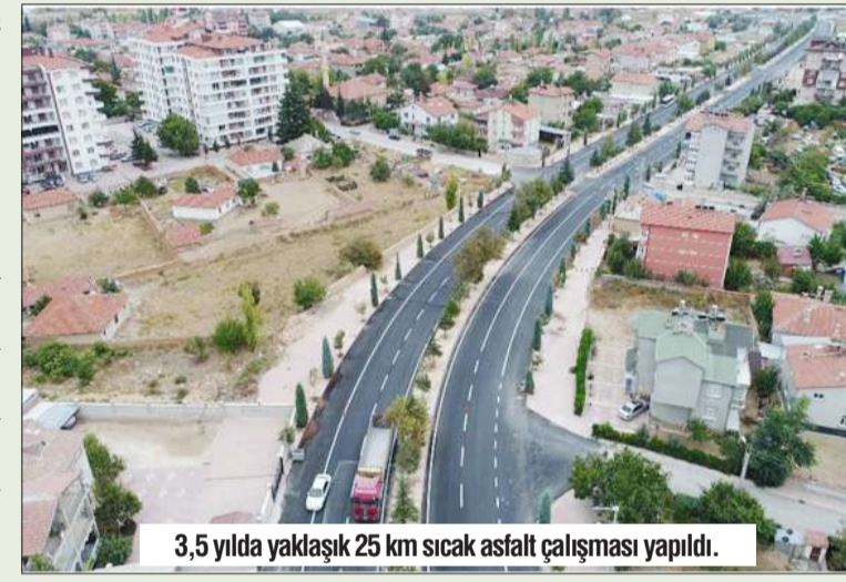
3,5 yılda yaklaşık 25 km sıcak asfalt çalışması yapıldı.