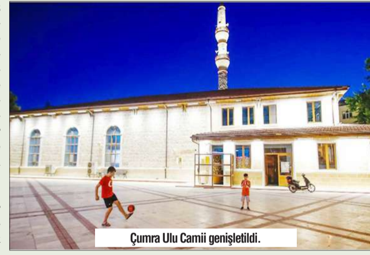
Çumra Ulu Camii genişletildi.

İmar sorununu çözdüğümüz mahallelerimizde 2022 yılında yaklaşık 900 bağımsız bölümün inşaatı devam ediyor. 400 Bağımsız bölüm ise tamamlandı. • Belediyemizin arsalarını kat karşılığı ile ihale ederek 125 yeni konutu belediyemize kazandırdık • TOKİ tarafından ilçemize kazandırılacak olan 200 konutun kuraları çekildi. • TOKİ ile Yeni İş Yerlerinin kuraları çekildi. • Belediyemiz öncülüğünde kooperatifler kurularak dar gelirli ailelerimizi ev sahibi yapmayı hedefliyoruz.