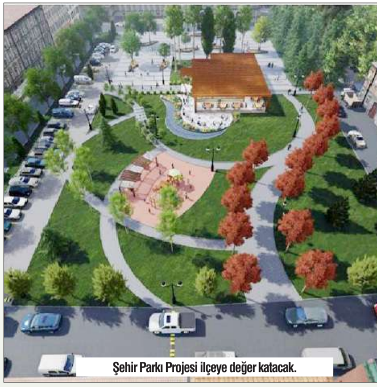
Şehir Parkı Projesi ilçeye değer katacak.