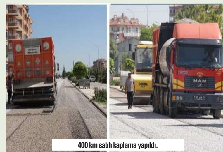
400 km sahn kaplama yapıldı.