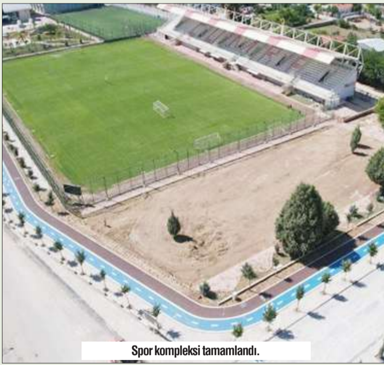
Spor kompleksi tamamlandı.

Sayın Cumhurbaşkanımızın Başbakanlığı döneminde başlatıldığı ve Yüz yıllık hayalimiz olan Mavi Tünel Projesi ile Toros dağlarından Akdeniz'e boşa akan sularımız Bağbaşı ve Bozkır Barajlarında tutularak Mavi Tünelden Konya ovasına ve Çumra'mıza akmaya başladı. Allah'a şükürler olsun. Hem tarımsal sulamada hem de içme suyu olarak Mavi Tünelden gelen memba suyunu kullanıyoruz. Mavi Tünel projesinin son etabı olan Afşar Barajı tamamlandı. Afşar Barajı ile Bağbaşı Barajı arasındaki 18 Km'lik Hadimi Tünelinde tünel açma çalışması devam ediyor. Birkaç sene içinde Afşar Barajından gelecek olan ilave sular AHİ Kanalı ile Hotamış göletinde toplanacak ve halen sulanamayan büyük bir tarım arazisi de sulanabilir hale gelecek inşallah.