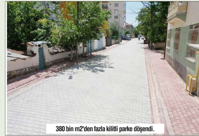
380 bin m2'den fazla kilitli parke döşendi.