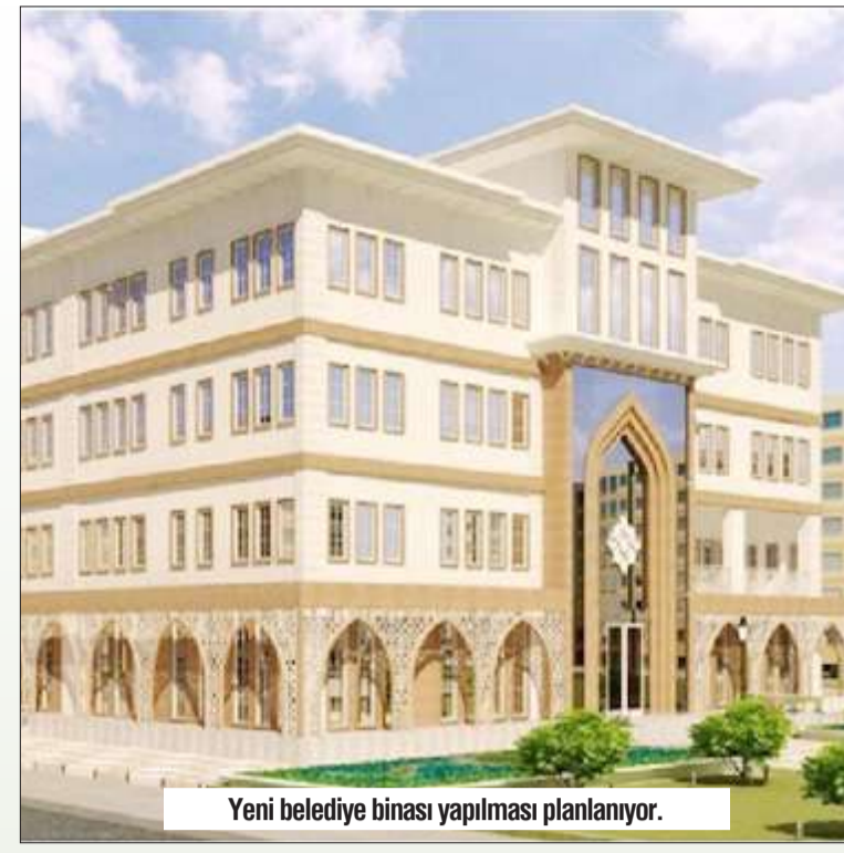
Yeni belediye binası yapılması planlanıyor.